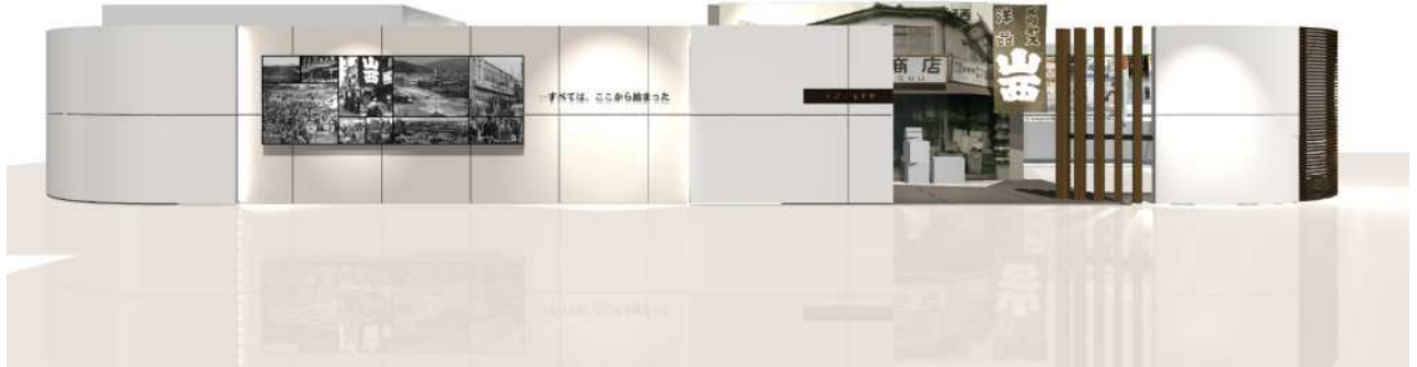
【正面にはイズミの原点「山西商店」の店舗を再現しました】

2 階「イズミ史料館」では、創業者山西義政の生い立ちから創業 50 周年までのイズミの歴史とともに、焦土から立ち上がった戦後広島の復興の歩みをあわせて展示しました。約 200 点からなる貴重な写真や、イズミ 50 周年を記念してまとめた映像資料を通じて、全国各地より商談などで来社をされる年間 50,000 人もの皆さまに、広島市民とイズミの先人たちによる生きる力の記録を広く伝えて参ります。私たちはイズミ史料館を通じて、創業地広島から、東日本大震災から立ち上がる全ての人々にエールを送ります。