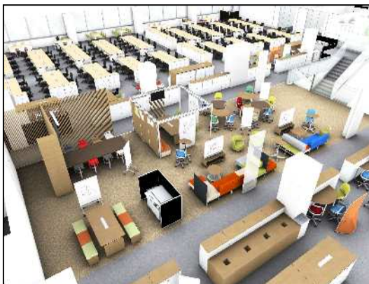
【オフィスとコミュニティスペースの融合】