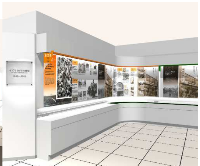
【イズミの 50 年史を紹介】