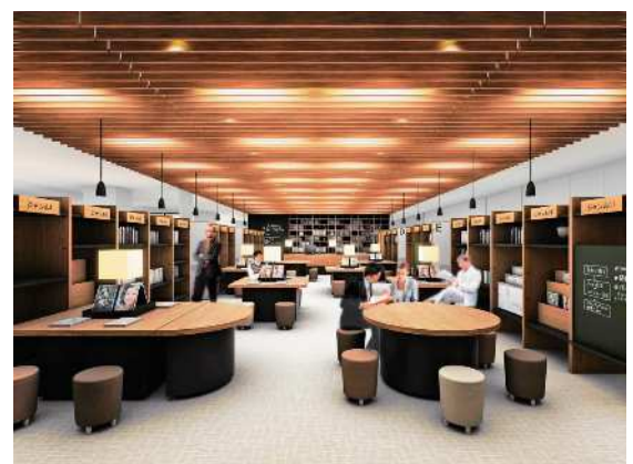
【情報スペース ゆめ図書館】