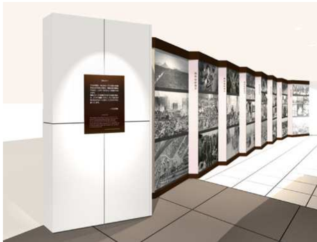
【被爆から立ち上がる広島市民の記録】