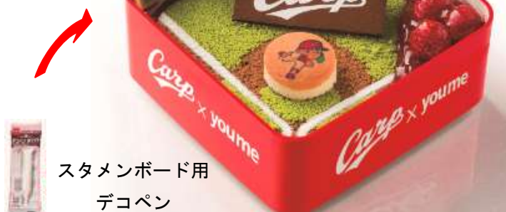
スタメンボード用 デコペン