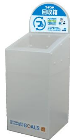
プチプチ回収ボックス