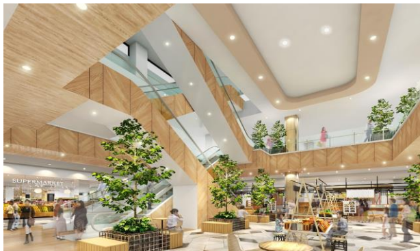
1F 吹き抜け：「NATURE（ネイチャー）」